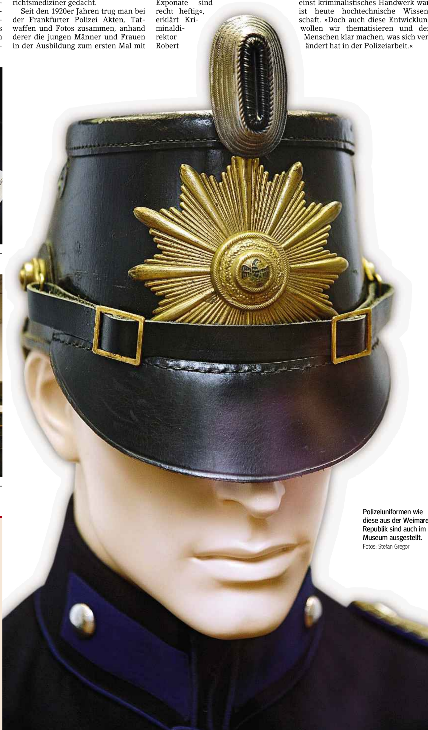
Polizeiuniformen wie diese aus der Weimarer Republik sind auch im Museum ausgestellt.

Im Polizeipräsidium finden auch regelmäßig die Dreharbeiten für den Frankfurter Tatort statt.