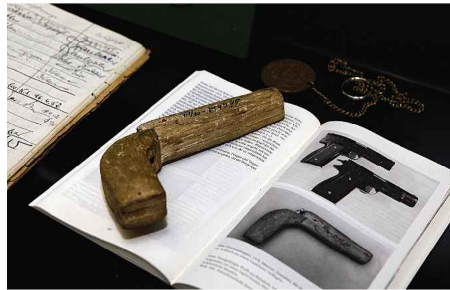
Solche Waffen aus Balsaholz sind zwar keine Walther PPK, die »Polizeipistole«, können aber durchaus auch funktionstüchtig sein.

Noch heute ist ein Gang durch die Sammlung Pflicht für jeden angehenden Kriminalbeamten, auch wenn heute die Polizeiarbeit eine andere ist als noch vor 20 Jahren. Was einst kriminalistisches Handwerk war, ist heute hochtechnische Wissenschaft. »Doch auch diese Entwicklung wollen wir thematisieren und den Menschen klar machen, was sich verändert hat in der Polizeiarbeit.«